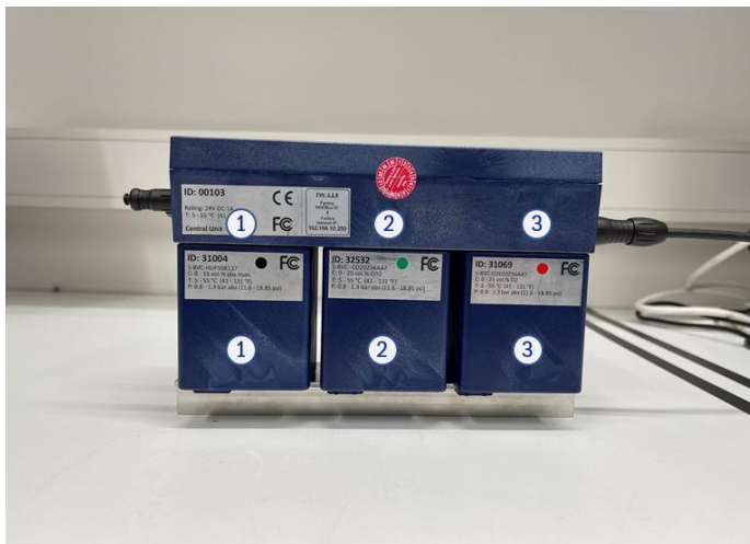
Abbildung 2: Exemplarische Darstellung der Kennzeichnung der Steckplätze durch Aufkleber auf der Rückseite des BlueVary

Hierzu kann man die Kartuschen durchnummerieren und die entsprechenden Nummern auch auf der Seite der Zentrale aufbringen. Wenn man die Kartuschen dann sowohl bei der Justierung, als auch bei der Installation identisch platziert wird nicht erneut nach einer 1-Punkt Justierung gefragt.